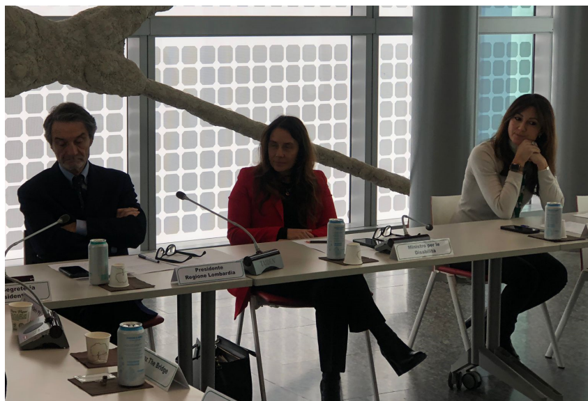
Incontro The Bridge, associazioni pazienti e caregiver, Ministro Locatelli, Presidente Lombardia Fontana

Come promesso nel corso del “Laboratorio nazionale delle associazioni di pazienti e dei caregiver” organizzato da Fondazione The Bridge a Milano lo scorso 5 novembre, il Ministro per le disabilità Alessandra Locatelli e il Presidente della Regione Lombardia Attilio Fontana hanno nuovamente incontrato una nutrita delegazione di oltre 40 sigle associative lombarde di pazienti e caregiver presso il Belvedere di Palazzo Lombardia. L'incontro a cui ha preso parte anche l'assessore regionale alla Famiglia, Solidarietà sociale, Disabilità e Pari Opportunità, Elena Lucchini , è stato pensato con l'obiettivo di approfondire il tema della giusta rappresentanza delle associazioni di pazienti e caregiver nella definizione delle policy sanitarie sia a livello regionale sia a livello nazionale.