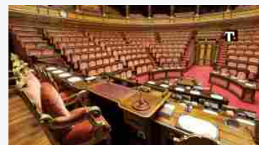
Farmaceutica, in Finanziaria spunta l'articolo che “attacca” il payback. Tetti di spesa all'8,3% nel 2024

“Mi fa piacere rafforzare questo dialogo con le associazioni dei pazienti, siamo arrivati all'implementazione della legge sanitaria regionale- ha dichiarato Letizia Moratti -. Quali interazioni è possibile rafforzare? Siamo di fronte ad un grande cambiamento culturale che vuole mettere al centro la persona e non la malattia e quindi la riorganizzazione dei servizi sanitari che creano una rete integrata sul territorio. Casa come primo luogo di cura, bisogni dei pazienti, intermediazione: in questo contesto è fondamentale il ruolo delle associazioni dei pazienti anche in relazione all'integrazione con i servizi socio assistenziali: non è possibile prendere in carico il paziente senza considerare il contesto in cui vive.