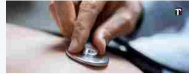
Piemonte, 10 milioni per la medicina territoriale