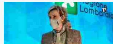
Sanità Lombardia, come sarà? Via Agenzia Controllo e Cure Primarie in Asst. Rumors