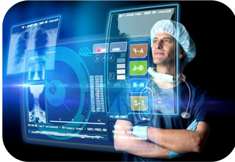
Aggiornamento della tecnologia e sviluppo di nuovi trattamenti