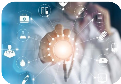
Settorialità del Servizio sanitario