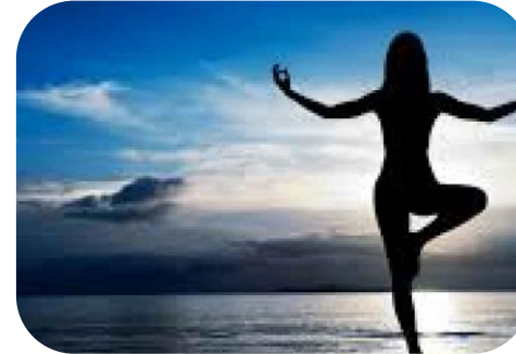
Aumento della consapevolezza dello stato di salute e nuove necessità sanitarie