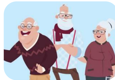
Invecchiamento della popolazione associato a prevalenza malattie croniche