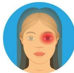
Cefalea a grappolo