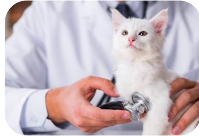
Parola d'ordine: prevenzione