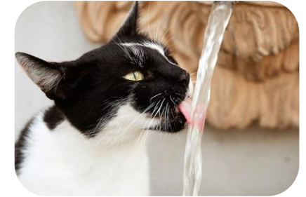
Idratazione e spostamenti