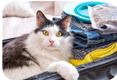
Cosa mettere nel suo «beauty»