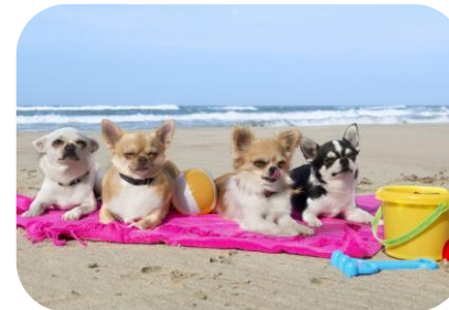
Al mare col quattrozampe