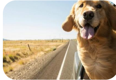
In viaggio: sicurezza e regole