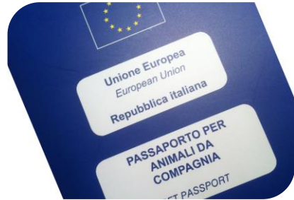
Occhio ai documenti