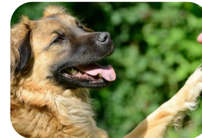
L'importanza del bon ton